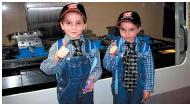
Национальная Металлургическая Академия Украины в Днепропетровске

Проблемы исследований и разработки новых, экологичных технологий, стоящие перед европейским и мировым сообществом, требуют решения масштабных задач и от промышленных предприятий. Принимая на себя определенные обязательства, в ходе сотрудничества с учебными заведениями и производителями, альянс может готовить технических специалистов нового поколения, способных обеспечить успешную работу компаний в условиях быстрого изменения рыночной среды и с учетом растущих экологических требований. ♡